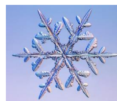
Flocon de neige

Les flocons de neige possèdent six branches car les molécules d'eau dans la glace s'organisent à l'échelle microscopique selon une structure cristalline hexagonale.