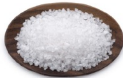
Document 2: Les cristaux retrouvés sur les lieux